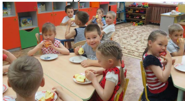
В этом доме все для нас – Сказки, песня и рассказ, Шумный пляс, Тихий час, –