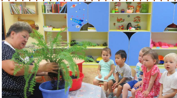
Там картинки на стене И цветы на окне.

Именно на них во многом лежит ответственность за формирование личности наших детей. Дошкольный возраст является крайне важным