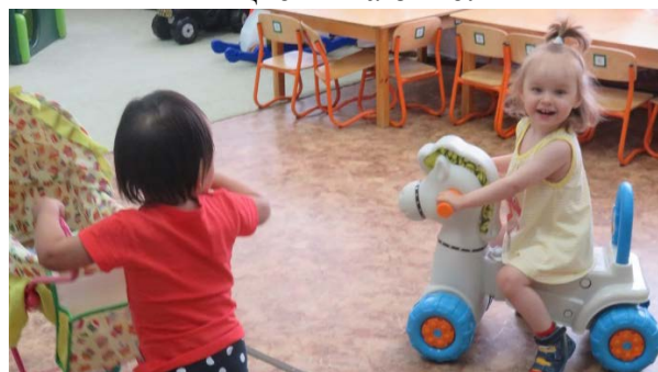
Захочу – Поскачу На игрушечном коне!