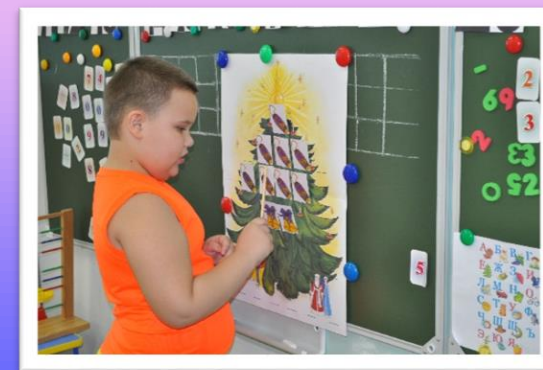
«Отвечаем на занятия»