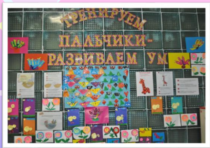
«Тренируем пальчики- развиваем ум» Развитие мелкой моторики