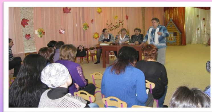
Совместные родительские собрания

Коллектив бережно передает школе своих «подготовишек»: представляет каждого ребёнка с различных позиций, позволяющих учителям с первого дня находить с ними общий язык, подбирать эффективные методы взаимодействия, находить точки соприкосновения с родителями первоклассников.