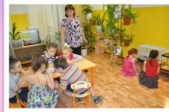
Занятие в «Уголке природы»