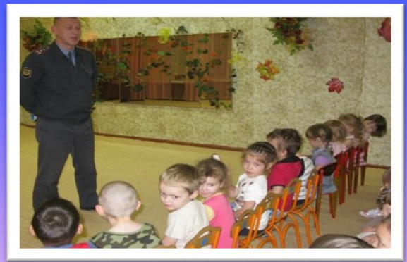
Встреча с работником ГИБДД

Когда ребёнок может любой вопрос задать Учителю, прохожему, конфликта избежать, Справляется отлично с беседой деловой, Мы говорим обычно: «Общительный какой!» Есть в коллективе мнение, и это не секрет: Для школьника общение – важнейший компонент!