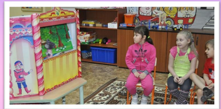
Кукольная постановка с исполнением ребят