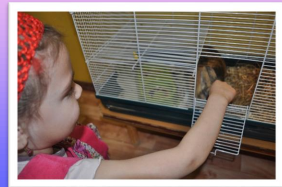
Общаемся с животными