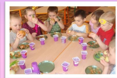
Проводим свой эксперимент