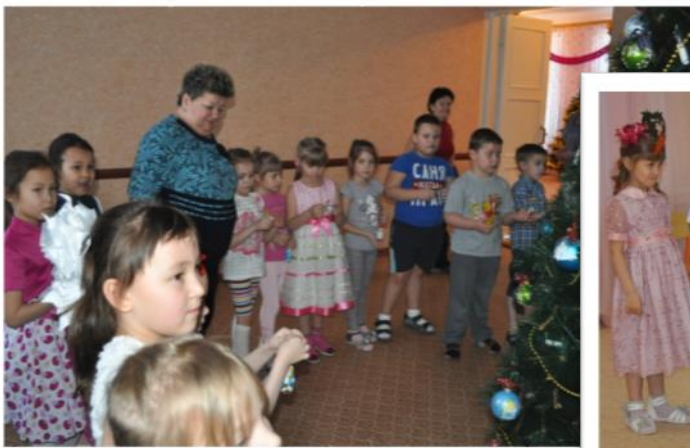
В ЦДО на празднике