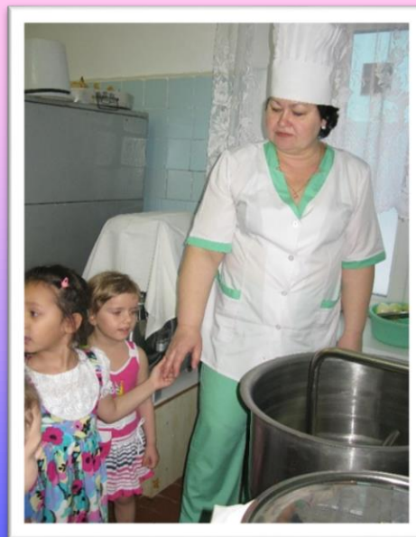
Знакомимся с профессиями