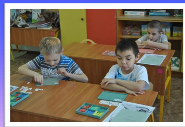
Формирование элементарных математических представлений

Расширить свои знания и становиться старше.