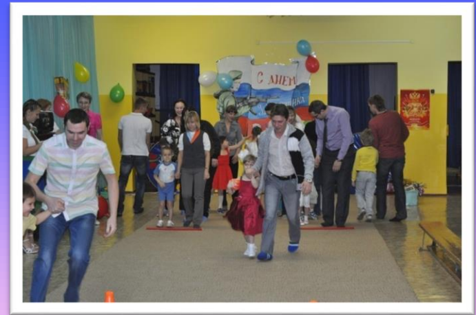
Развлечение «Спортивные родители + Спортивные дети = ЗДОРОВАЯ СЕМЬЯ»

Физически готовы они к школьным перегрузкам.