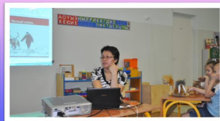
Расширение знаний о природе нашего края