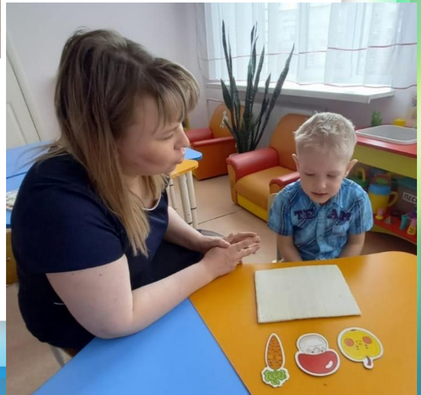
Игра «Договори словечко»