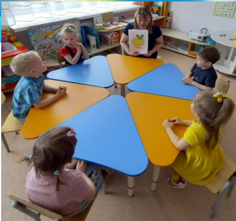
Игра «Найди звук»