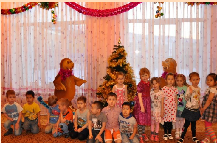
МАОУ ДОД «Центр дополнительного образования детей Иульгинского района»