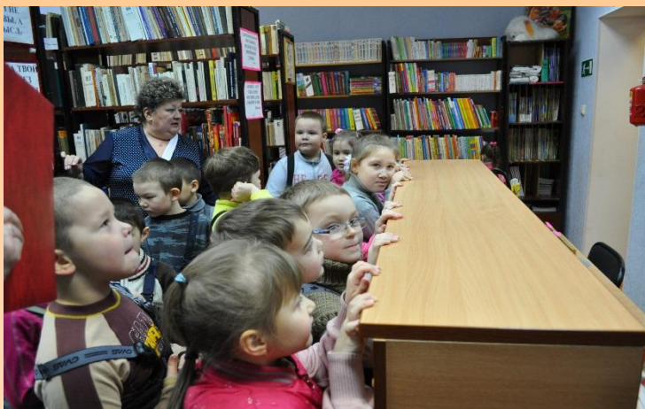
МБУК «Централизованная библиотечная система Иульгинского района»