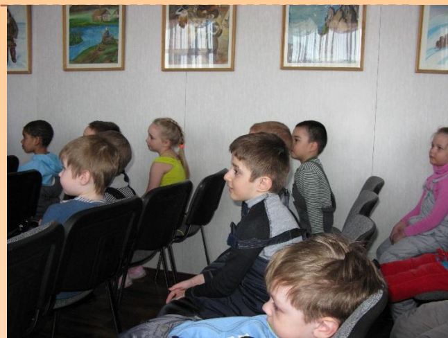
МАОУ ДОД «Иульгинская районная детская школа искусств»