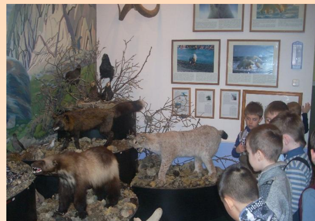
МБУК «Эгвекинотский районный краеведческий музей»